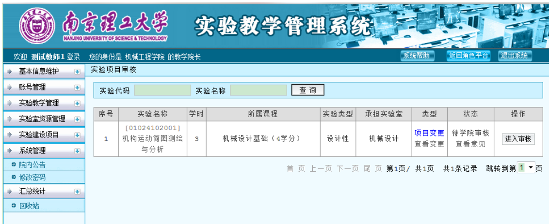
图 14 教学院长审核实验项目

登录系统，点击“基本信息维护”，进入“实验项目审核”，查看所有的的申请审核操作。点击“类型”列的“查看变更”，可以查看项目变更前后的对比列表。点击“进入审核”填写审核意见。如图 14、图 15 所示。