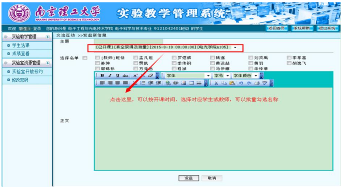
图 45 学生发送消息

点击“发起新消息”，可以向本实验项目的其他学生或实验教师单个或批量发送，如图 45 所示。