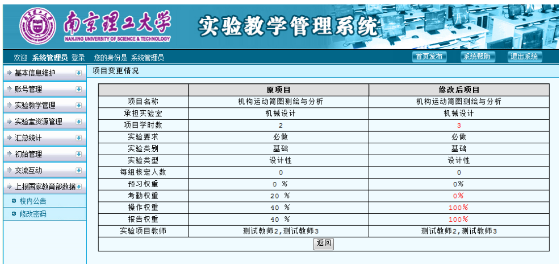
图 22 项目变更查看界面