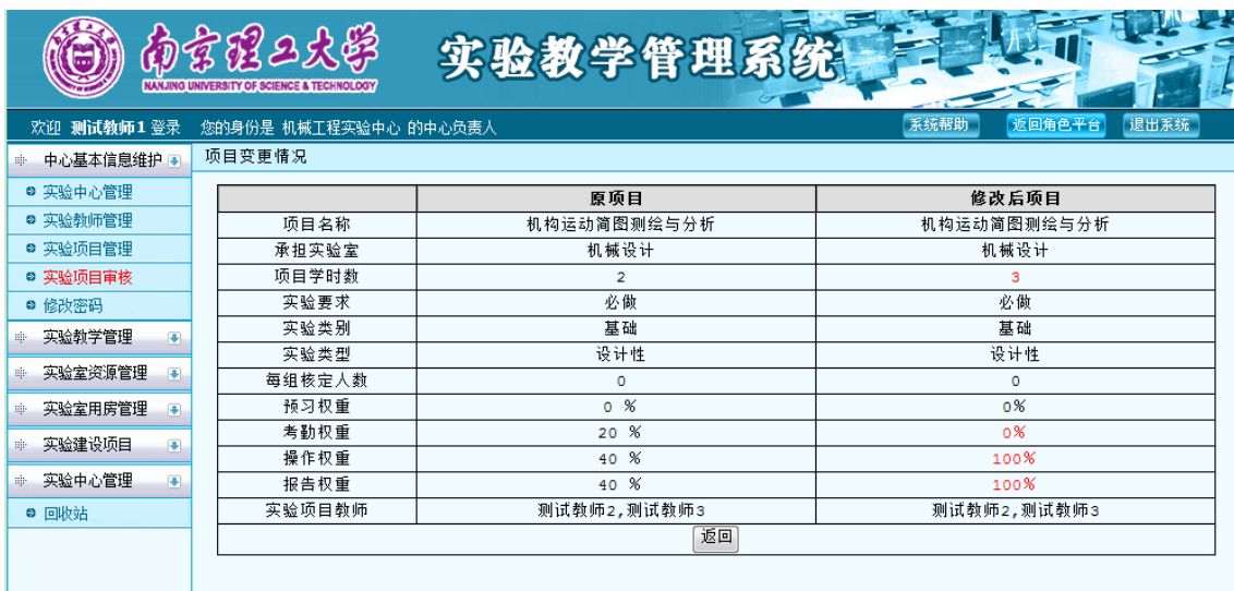
图 13 项目变更查看界面