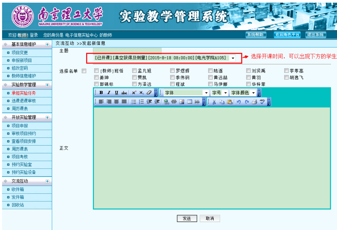
图 38 发布消息

点击“发布新消息”可对本学期自己带实验的学生单个或者批量发送。如图 38 所示。