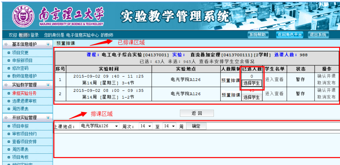
图 31 预置排课界面