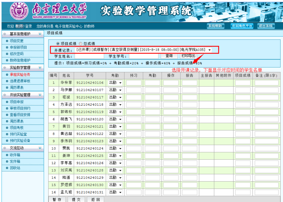
图 34 项目成绩维护

考勤列默认“出勤”，若学生有其他情况，点击考勤列选择“缺勤”等其他选项，若学生本实验项目不通过，点击“考勤”列选择“重修”。其他特殊情况（如旷课、临时请假等），可在成绩格中填写不超过 5 个字的说明。