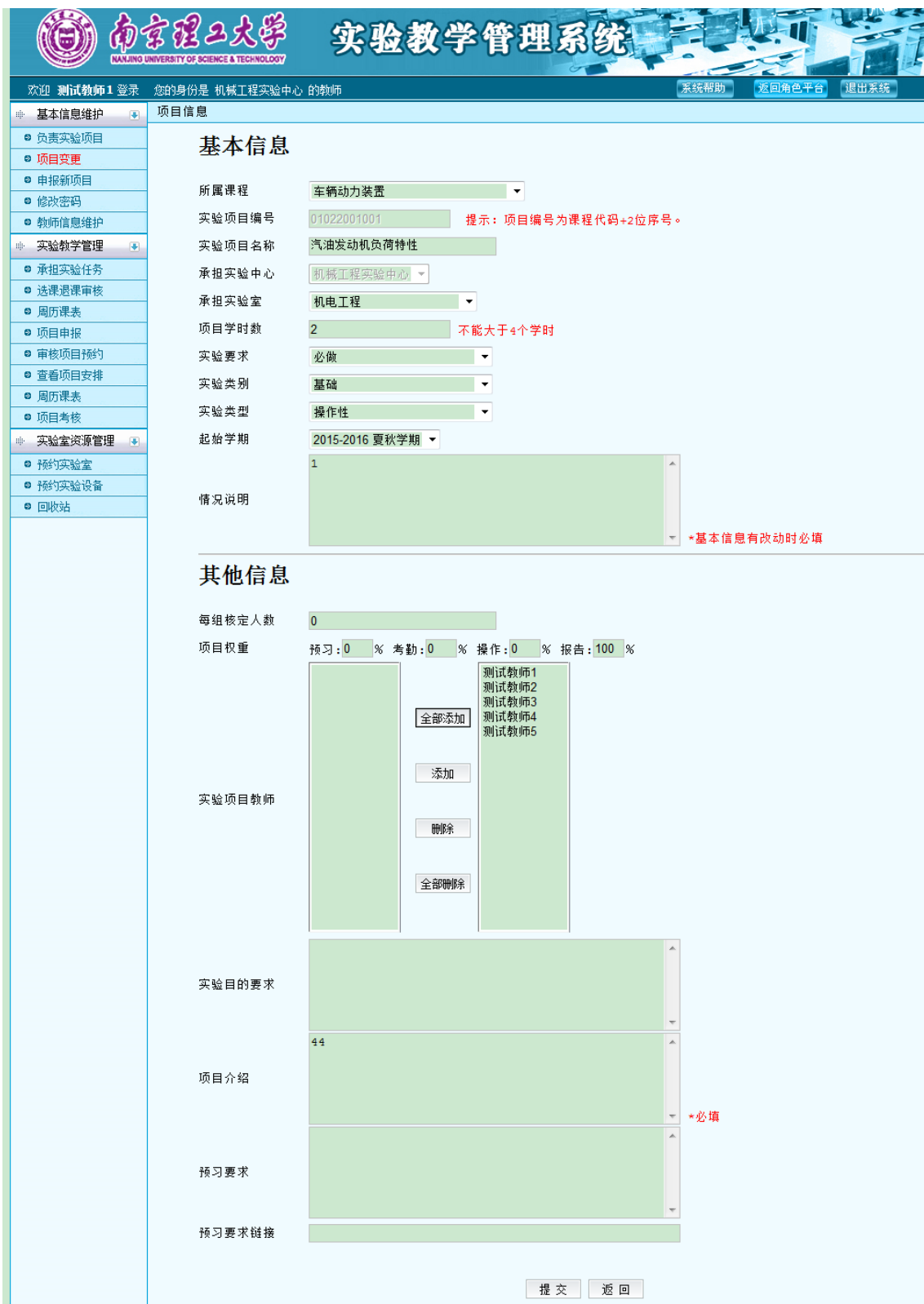
图 4 项目信息修改

“基本信息”修改时，需要选择变更实验项目的“起始学期”，起始学期之前，系统继续使用修改前的项目，从起始学期开始，系统使用修改后的实验项目。