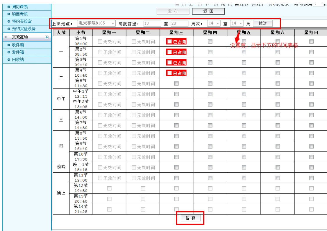
图 29 预约排课操作区域