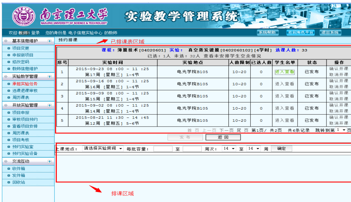
图 27 预约排课界面