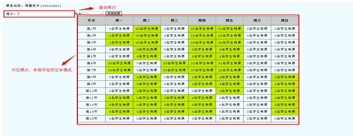
图 28 未选学生空余情况查看

(3)根据实验室的实验仪器台套数填写实验室可容纳的学生数量，点击“选择实验房间”设置实验地点，并选择开设实验的周次，点击“确定”按钮，下面会显示对应周次的可排课时间表，教师进行排课操作。如图 29 所示。