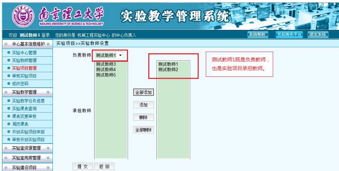
图 11 设置责任教师和实验教师