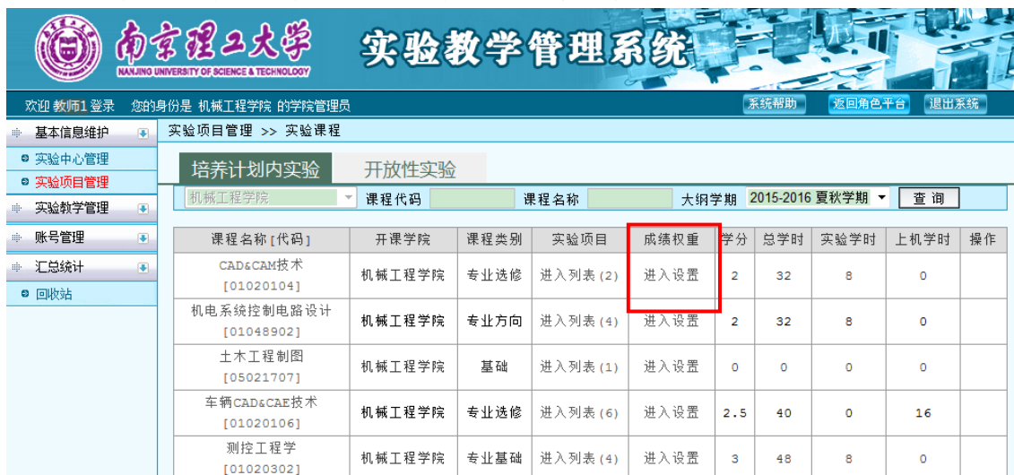
图 17 课程实验总成绩权重设置