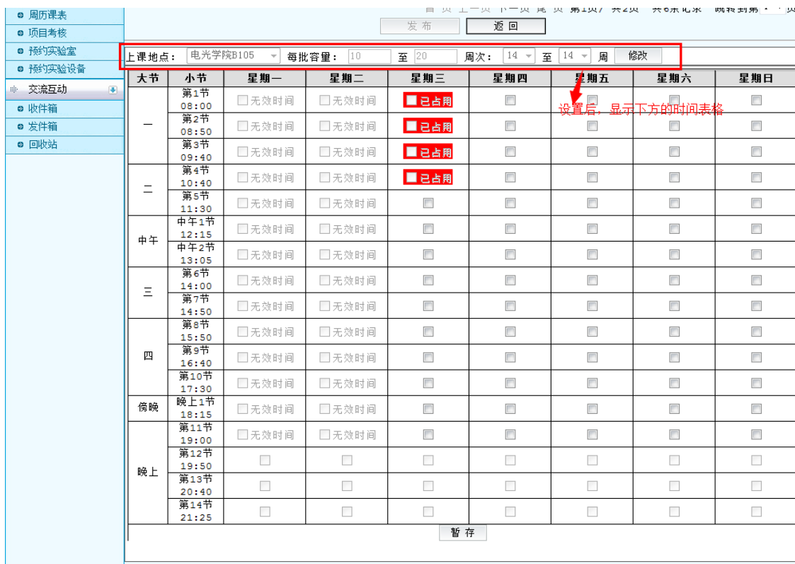
图 32 预置排课操作区域