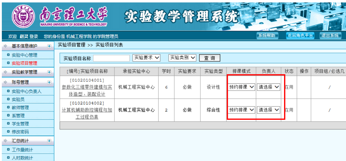
图 19 实验项目排课模式设置