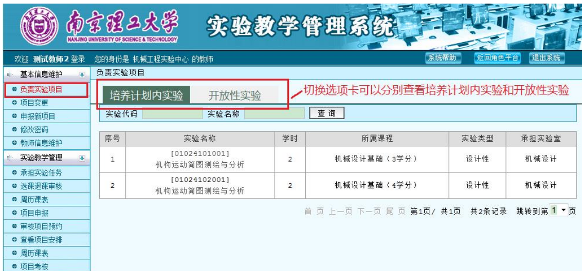
图 2 负责实验项目

教师登录实验教学管理系统，点击“基本信息维护”进入，可见“负责实验项目、项目变更、申报新项目”等二级菜单。点击“负责实验项目”，查看本人所负责的全部实验项目，包括培养计划内实验项目和开放性实验项目，如图 2 所示，并根据培养计划调整进行“项目变更”或者“申报新项目”。