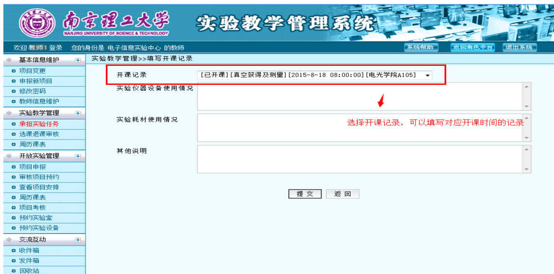
图 36 实验记录维护界面

在教师承担实验任务界面，如图 24 所示，点击进入实验记录界面，如图 36 所示。点击“开课记录”列表，选择对应课表填写该次实验的实验仪器设备、耗材等使用情况。