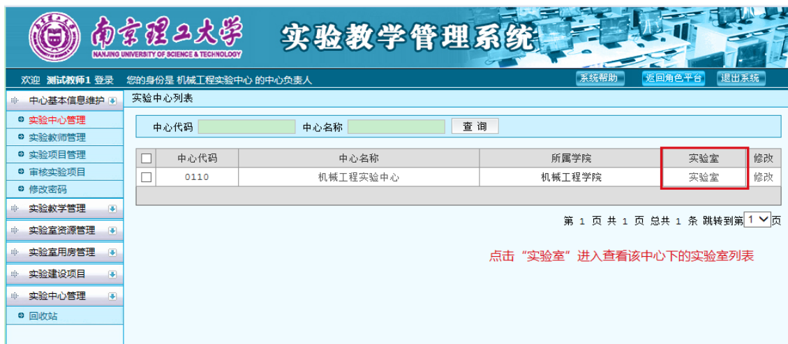
图 7 实验室列表

中心负责人可以点击“实验室”、“实验分室”进入对应界面查看、修改、删除、添加所在实验中心下设的实验室、实验分室。本系统已预置了由学校实验室主管部门提供的数据，如图 7、图 8 所示。