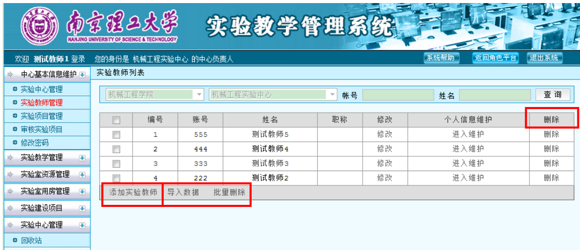
图 9 实验教师列表

系统首次运行，中心负责人须点击“添加实验教师”，从本学院教师列表中选择为本中心实验教师。在日常维护管理中，中心负责人可“删除”和“添加实验教师”调整所在中心的实验教师（如图 9 所示）。