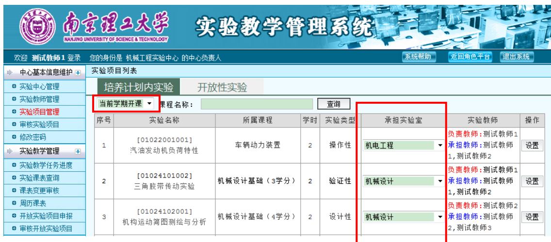
图 10 承担实验室

点击“设置”按钮分别选择项目责任教师和承担实验任务教师。若责任教师也承担实验任务，则需同时设置责任教师和承担教师双重身份，如图 11 所示。