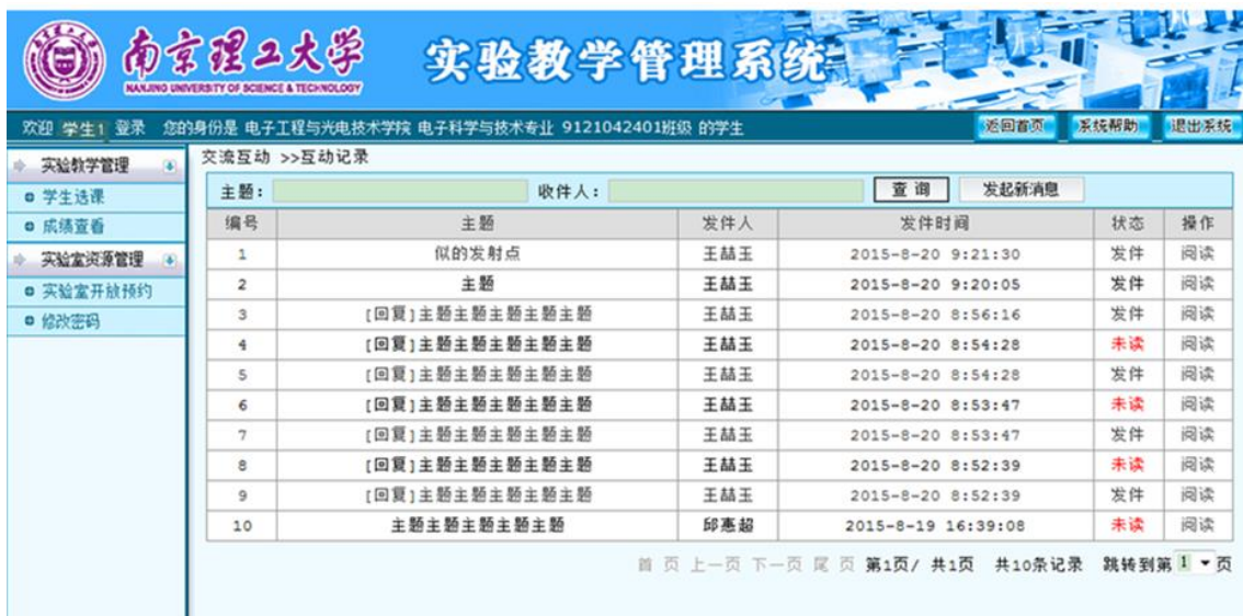
图 44 学生交流互动

点击“发起新消息”，可以向本实验项目的其他学生或实验教师单个或批量发送，如图 45 所示。