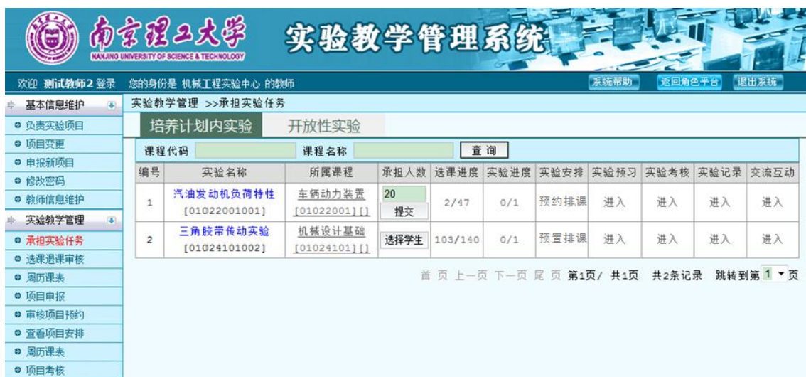
图 24 承担培养计划内实验任务

如图 24、图 25 所示，在一级菜单“实验教学管理”下，点击“承担实验任务”，实验教师可以看到本学期所承担的培养计划内实验任务和开放性实验任务。在承担实验任务界面，点击进入“实验安排”、“实验预习”“实验考核”、“实验记录”以及“交流互动”完成相关操作。