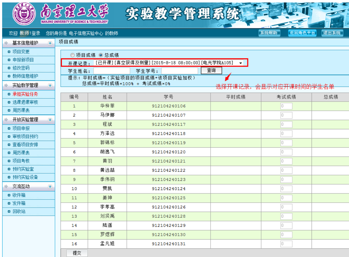
图 35 总成绩维护界面