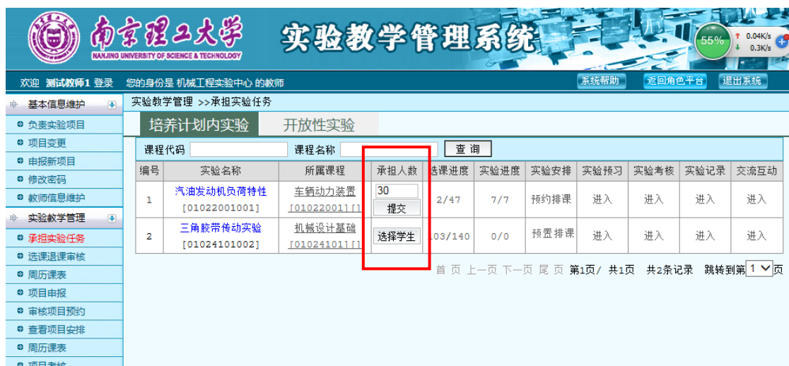
图 26 设置本人承担的学生人数

当两个或者两个以上教师承担同一个实验项目时，在排课之前，教师需要先设置自己所承担的学生人数，如图 26 所示，最后一名教师设置的承担任务量不得少于该实验剩余任务量。所以，在排课前，应由中心负责人主持协商确定每位教师指导学生人数。