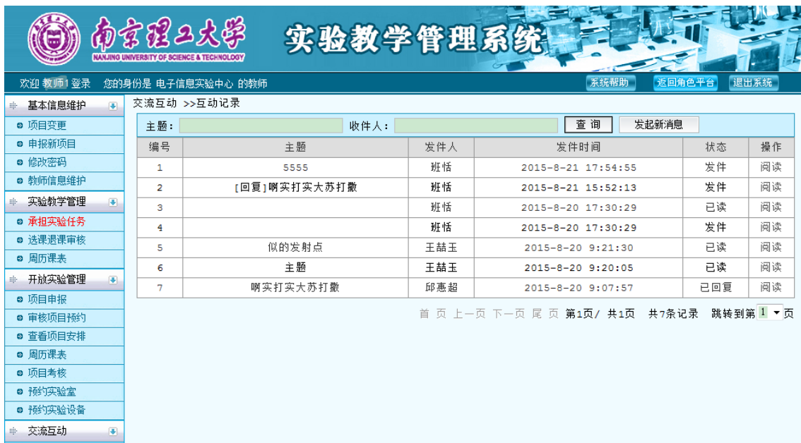
图 37 交流互动

点击“发布新消息”可对本学期自己带实验的学生单个或者批量发送。如图 38 所示。