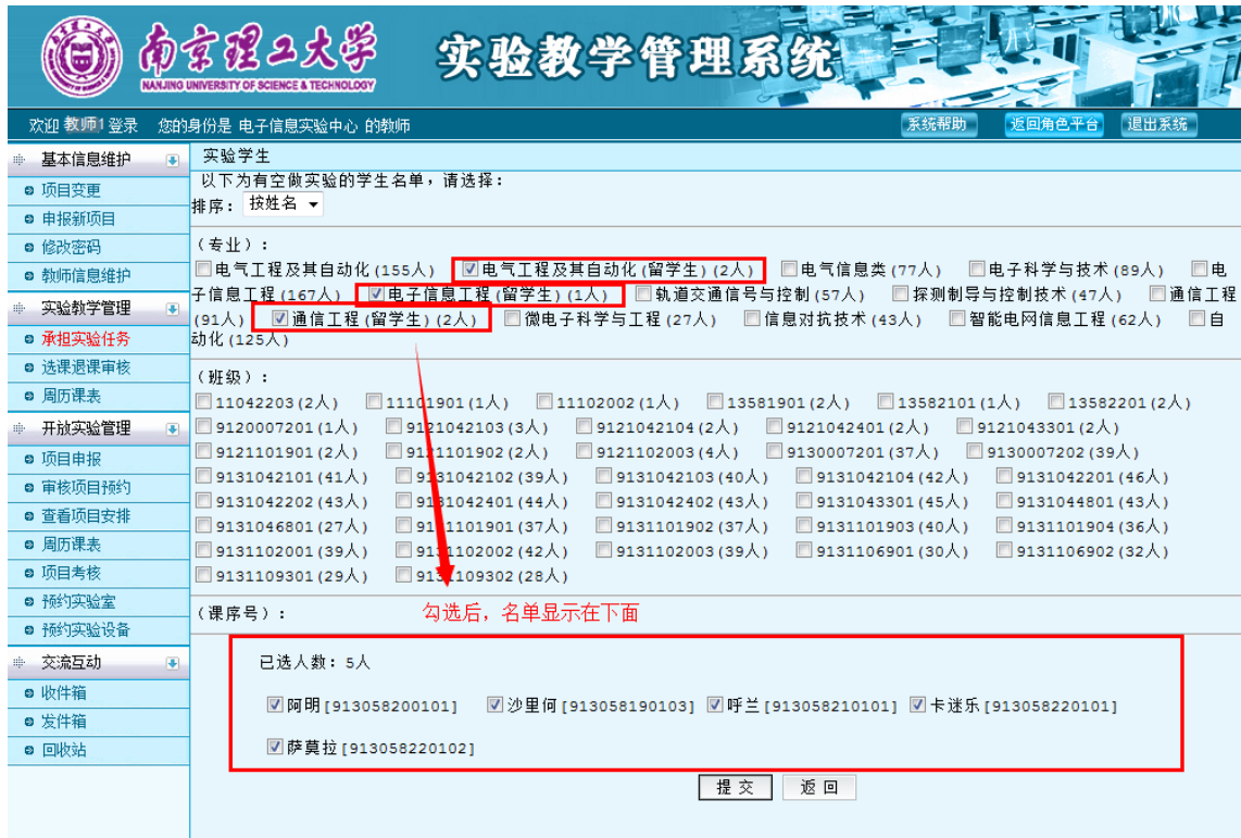
图 30 选择学生界面