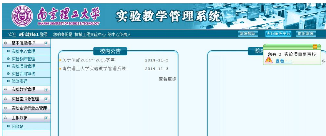
图 6 中心基本信息维护