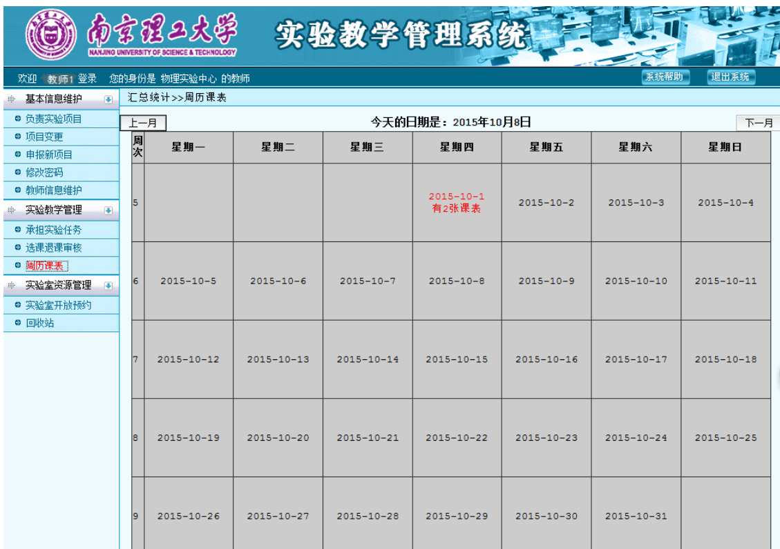
图 40 周历课表

点击菜单栏的周历课表，查看本人已安排的课表，课表如图 40 所示。点击图中的课表，可以查看实验项目的具体信息，如图 41 所示。