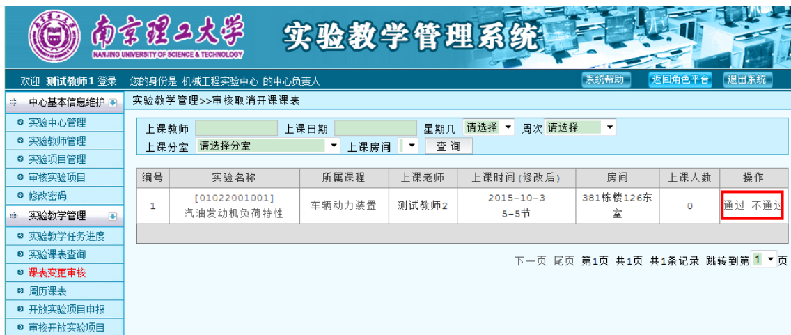
图 46 课表变更审核列表