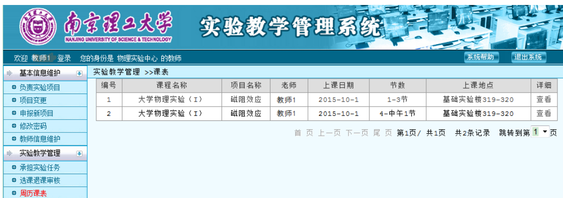
图 41 课表详细信息