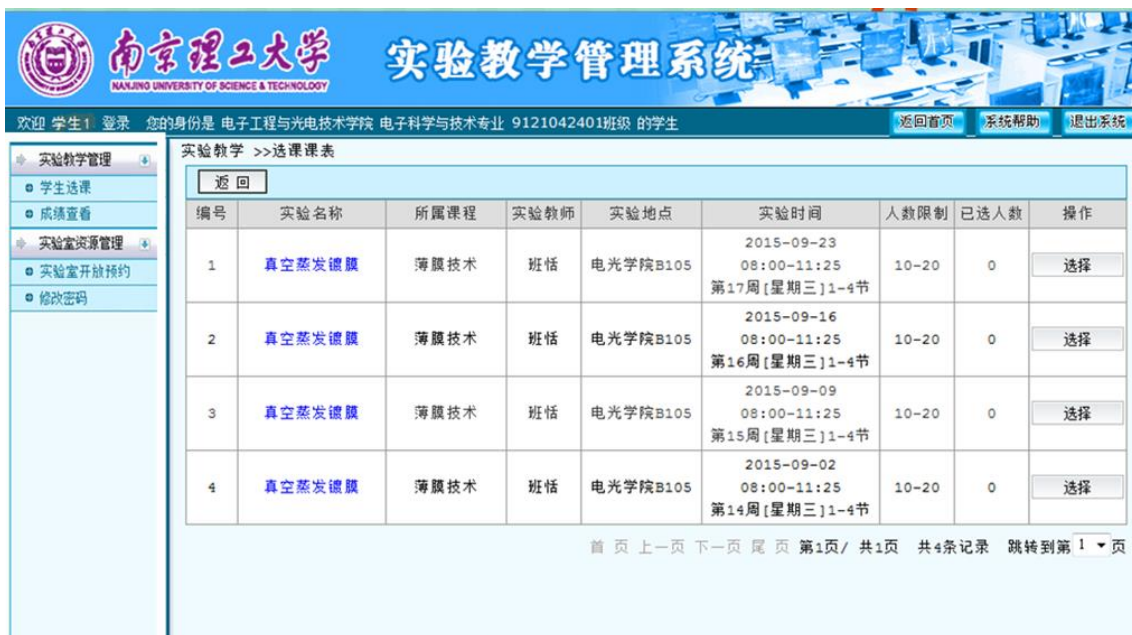
图 43 选课界面（选择实验时段）