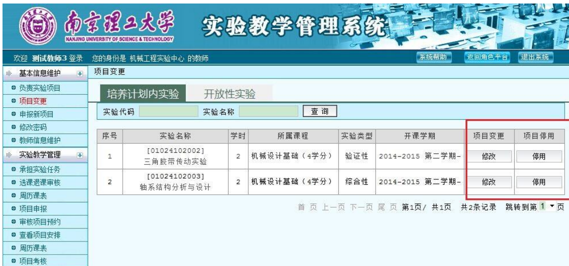
图 3 变更实验项目

教师可以根据培养计划调整需要对自己负责的实验项目进行项目变更。项目变更包括项目信息“修改”和项目“停用”。点击“项目变更”，进入项目列表。点击“修改”和“停用”按钮，如图 3 所示，分别进入项目信息修改和项目停用操作界面。