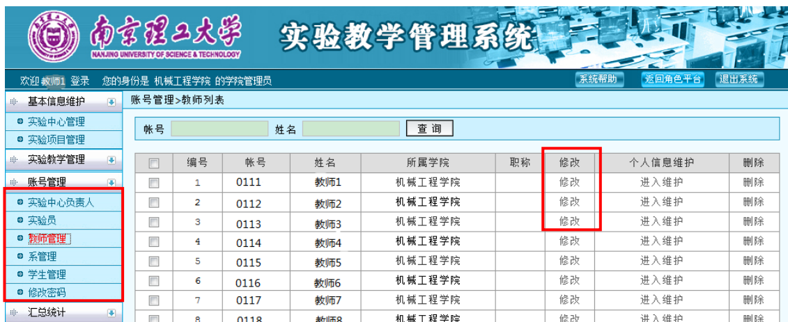
图 20 各类人员信息维护、密码重置

登录系统，进入“账号管理”，点击“修改”可以维护本学院实验中心负责人、教师、学生等基本信息，如图 20 所示。