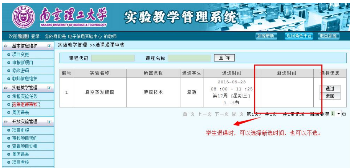
图 39 学生退课审核