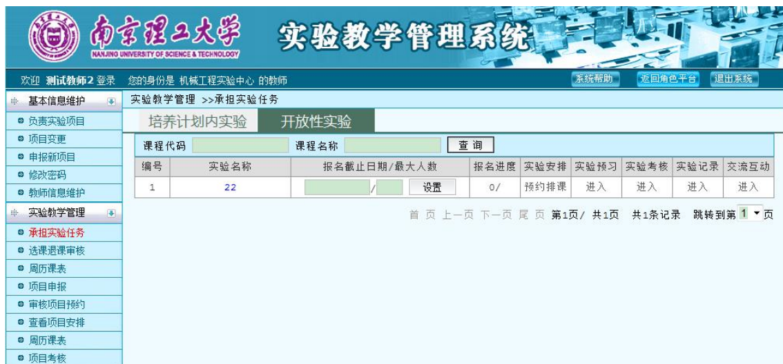
图 25 承担开放性实验任务