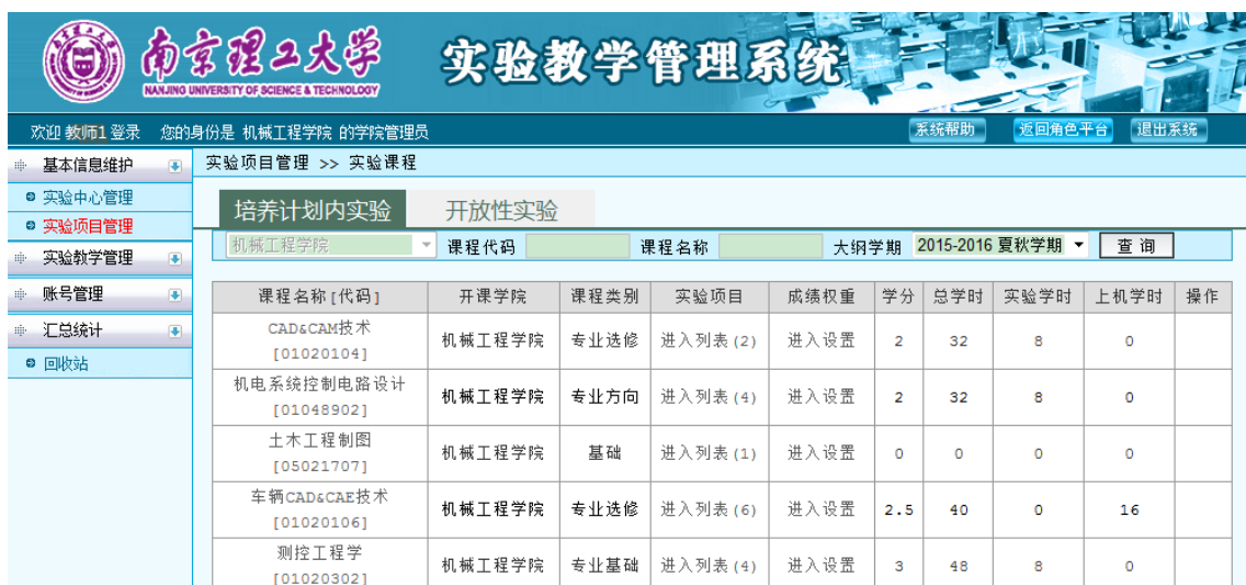
图 16 学院开设的实验项目列表

登录系统，点击“基本信息维护”，进入“实验项目管理”，可见本学院开出的全部实验课程，如图 16 所示。