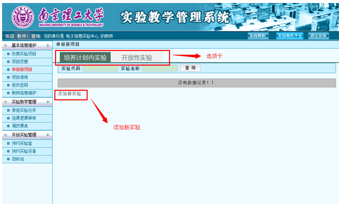
图 5 申报新实验

因培养方案中课程的学时是相对固定的，一般情况下，新增一个实验项目，必须停用一个现有实验项目，保持实验学时数不变，同时应修改课程大纲。如要调整课程总的实验学时，除修改课程大纲外，还应履行培养方案调整审批手续。