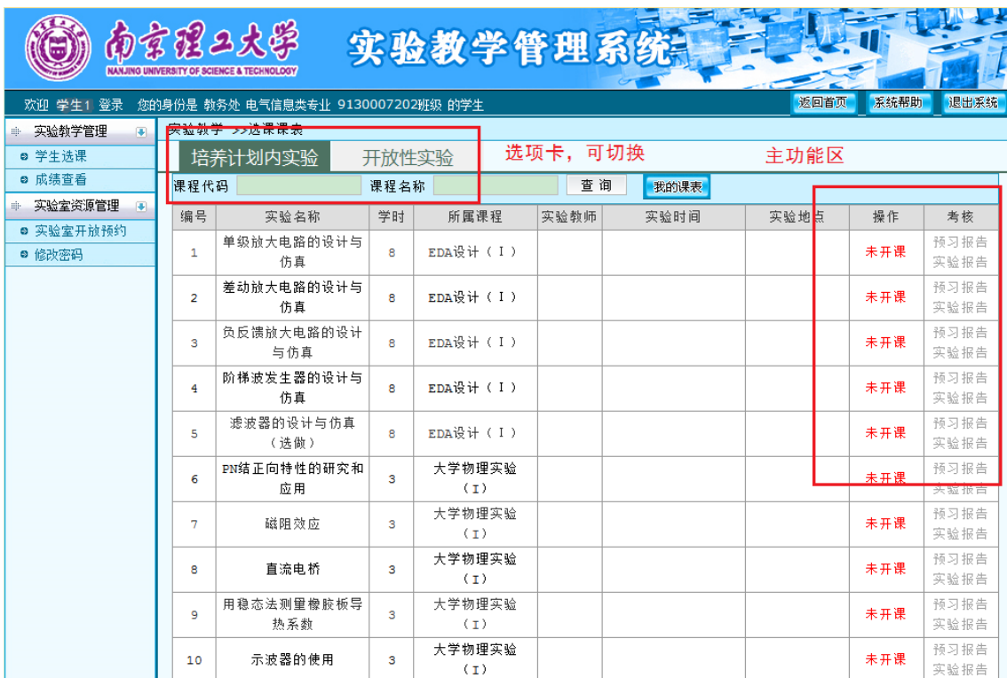
图 42 学生选课

注意事项： 学生应经常登录本系统，关注自己的实验项目任课教师发布的可选时段，及时选择，按选定的时段到相应实验室进行实验。关注实验安排的调整，及时补选。