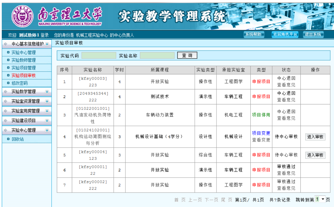
图 12 中心审核实验项目

查看所有的申请审核操作。点击“类型”列的“查看变更”，可以查看项目变更前后的对比列表，如图 12、图 13 所示。点击“进入审核”填写审核意见。