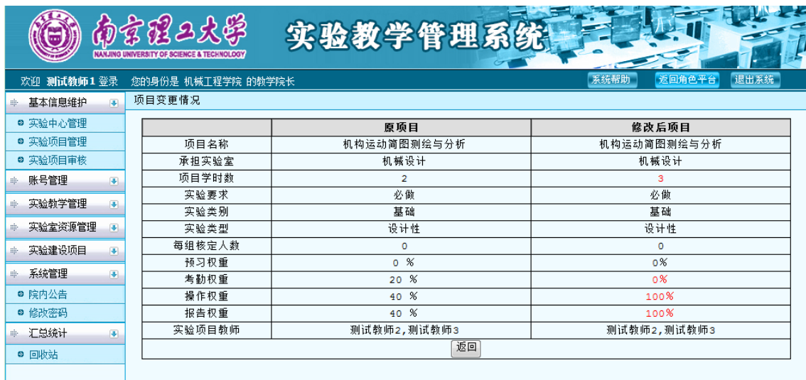
图 15 项目变更查看界面